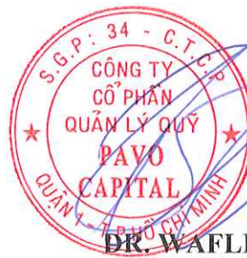
DR. WAFLER BEAT HANS

T/M ĐẠI HỘI ĐỒNG CỔ ĐÔNG CÔNG TY CHỦ TỌA ĐẠI HỘI